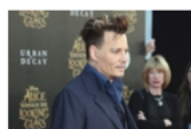
Отказва да се прибере в Лос Анджелис