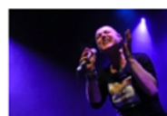
Полицаята в Чикаго издирва Шинейд О'Конър