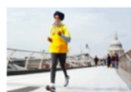
Торпедото с тюрбан