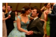
„Аз преди теб“: Романтичният хит на лялото